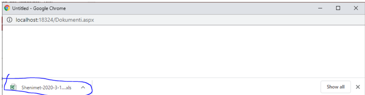
Fig. 4. Shënime të exportuara në Excel